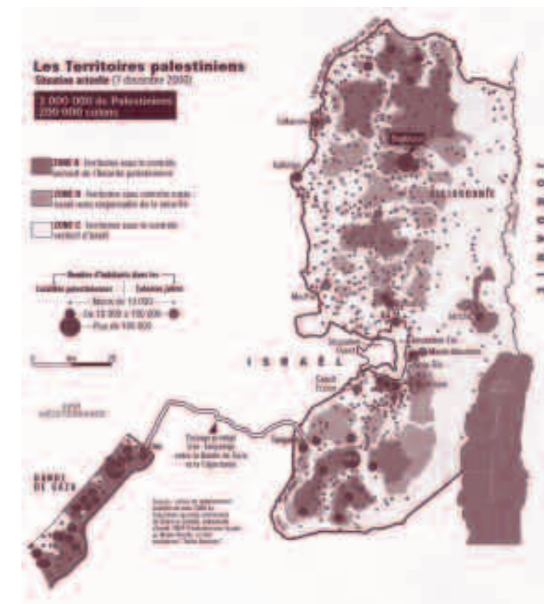
Carte par Dominique Vidal et Philippe Rekacewicz, Le Monde diplomatique , février 2007